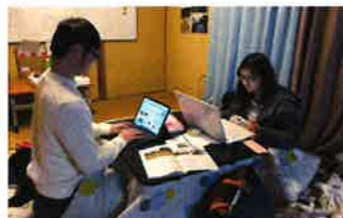
パンフレット合宿最後の追い込み

農村16きっぶの活動や集落について、より多くの方々に知ってもらうために年に1回、このパンフレットを作成しています。見る人が楽しくなるパンフレットを目標に活動しています。