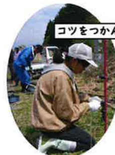
コツをつかんだぞ!

前の週末に行ったボランティアの反省を共有します。その後、今週末のボランティアに行く人を決めます。また、3つの班に分かれてグループ活動を行います。(グループ活動については9ページを参照)