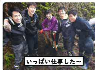
いっぱい仕事した～