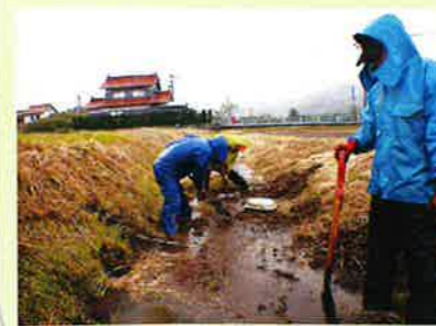
雨の中の水路清掃

集落まで車で移動します。そこで、田植えや草刈り、水路清掃などの作業をします。学生は暑い日でも寒い日でもいつも全力です。また、昼食や休憩、作業を通して集落の方々と交流を深めます。交流を楽しみにしている学生も多くいます。