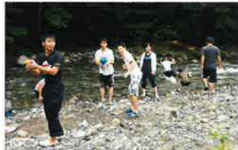
夏の村咲クの川遊び

夏と冬の年に2回、集落と学生をつなぐをテーマに「村咲ク」と題した川遊びや逃走中などのイベントを開催しています。企画から運営までを自分たちで行い、みんなで楽しめる空間を作る活動をしています。