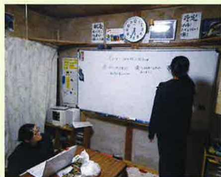
ボランティア後の反省会

ボランティア終了後に良かった点や悪かった点、楽しかった点を話し合います。そして、その内容を次回の会議でスタッフ間で共有します。また、ボランティアの内容や感想を報告書にまとめたり、多くの方々に見てもらうための様々な広報活動を行っています。(広報活動については下記を参照)