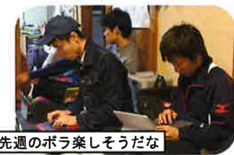
先週のボラ楽しそうだな

ボランティアの申請がきた集落の担当者を決めます。担当者は依頼がきた集落に作業内容や人数、持ち物などの確認を電話でします。