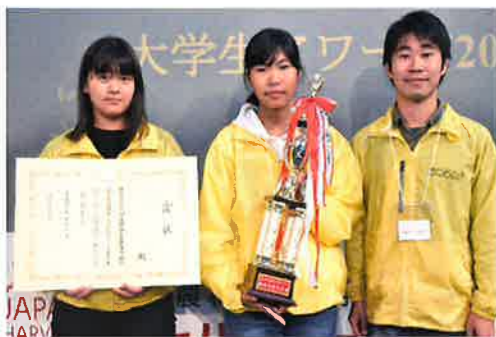
農林水産大臣賞受賞後の様子

「食と農林漁業大学生アワード2018」に出場し、史上初2回目の農林水産大臣賞を受賞することが出来ました。「食と農林漁業大学生アワード」とは、食や農林漁業に関する取組を行っている学生団体や大学の研究室によるプレゼン大会です。書類審査によって選考された10団体が発表しました。受賞という形で評価していただけたことは、今ある農村16きっぷという団体を築き上げてくださった集落の皆様・先輩方のおかげです。これからも私たち農村16きっぷをよろしく願います。