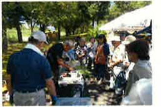
○夏休み親子おもしろ教室(7月28日/中止)