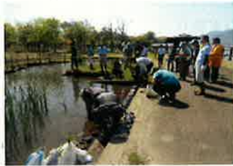
○春の健康散策ウォーキング(5月19日)