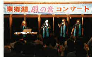
○あやめ秋の感謝祭(10月6日・7日・8日)