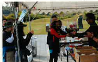
○ターゲットバードゴルフあやめ池大会(11月16日) ○メダカの会「鮭の遡上&野鳥ウォッチング」(11月17日)