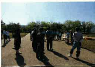
○春のメダカボランティア(4月21日)