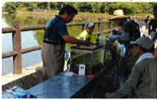
○メダカ遊園地生物生息実態調査(8月4日)