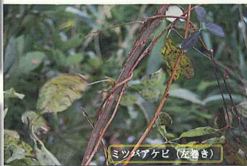
ミツバアケビ (左巻き)