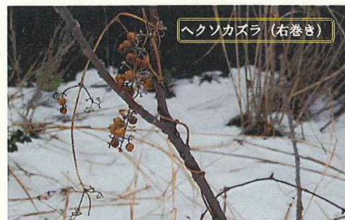
ヘクソカズラ (右巻き)