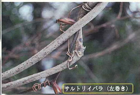
サルトリイバラ (左巻き)