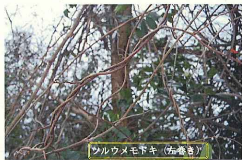
ツルウメモドキ (左巻き)