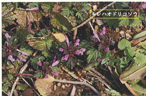
キレハオドリコソウ

立春を過ぎた頃、そしてバレンタインの日に、列島は想定外の大雪に見舞われました。 これからもまだ寒気があるかもしれません。やはり、動植物は、今冬の大雪を敏感に感じ取っていたのです。 この大雪に大きな不便を被った人類ですが、動植物にとってはこれも想定範囲内のことなのでしょう。 きっとこの雪にも埋もれることないカマキリの巣の中で、小さな命は凍死することなく春の訪れを待っていることでしょう。