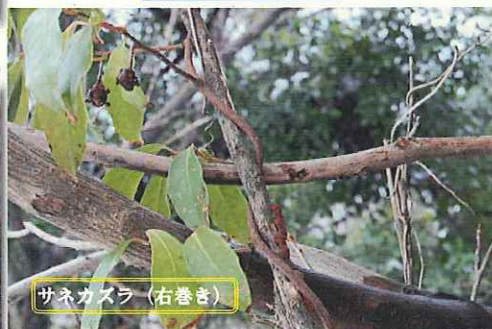
サネカズラ (右巻き)