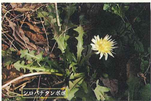
シロバナクンボク