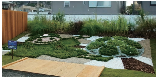
岡山市 晴れの国おかやまからの桃太郎シュート! ～未来へ2013～