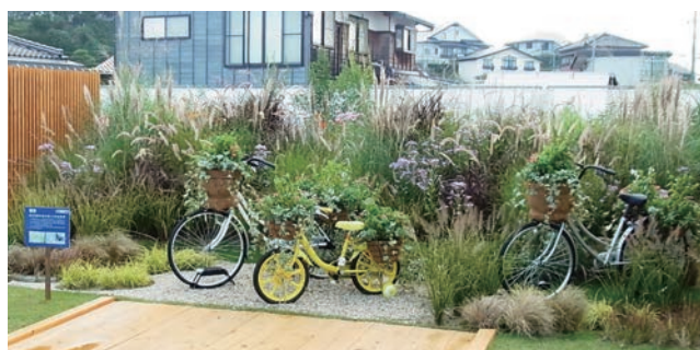
堺市 ちずの 百舌鳥野の風を感じる花自転車