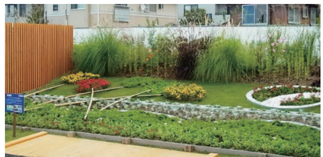
新潟市 チューリップのまち新潟