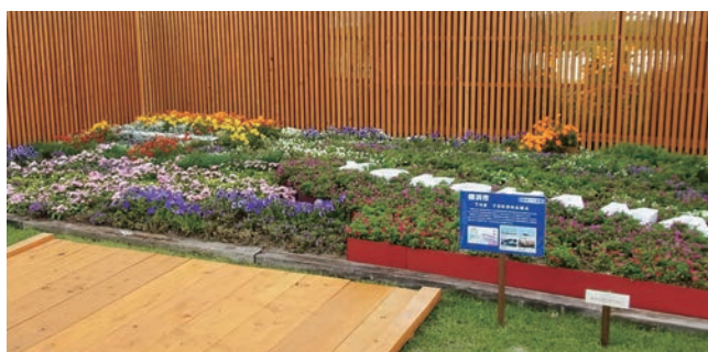
横浜市 THE YOKOHAMA