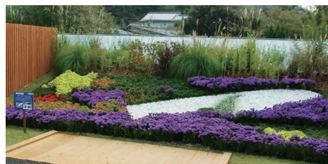
相模原市 未来、つなぐ、さがみはら