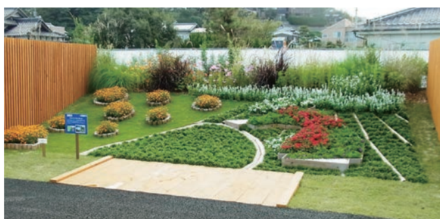
静岡市 茶娘のはな唄と富士山