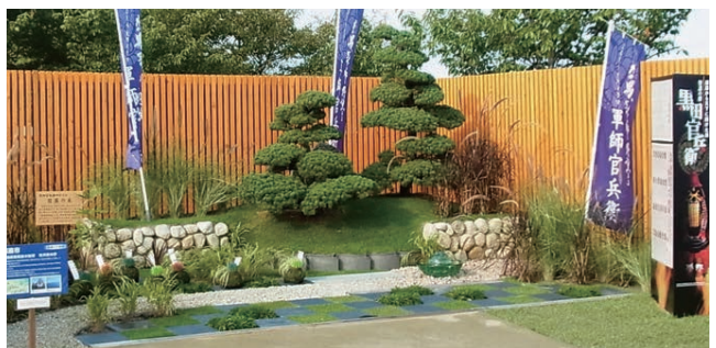
姫路市 播磨国姫路の智将官兵衛の夢