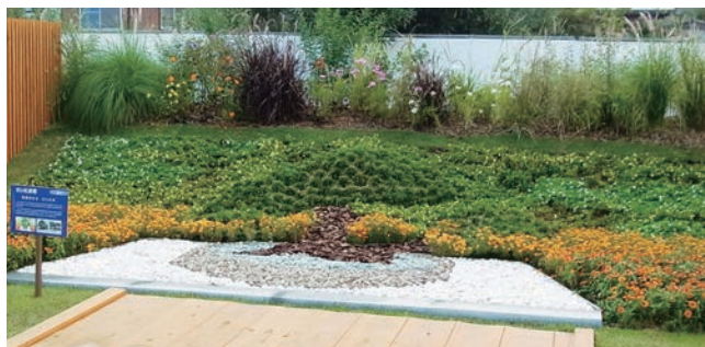
さいたま市 盆栽のまち さいたま