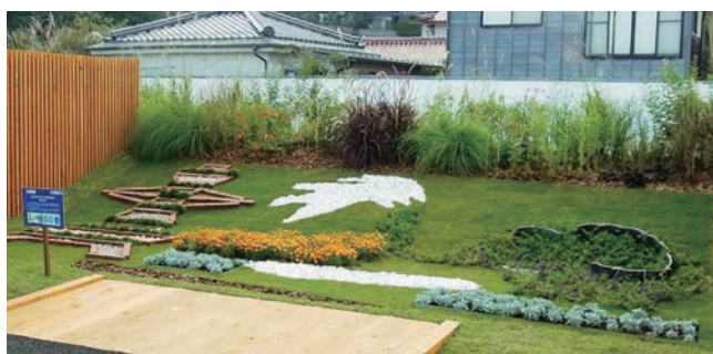
大阪市 新世界&天王寺動物園百年祭