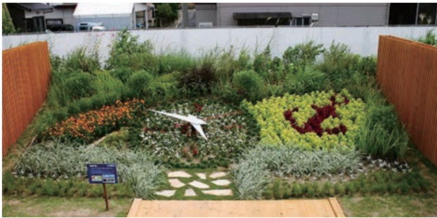
神戸市 みなとに浮かぶ花ものがたり