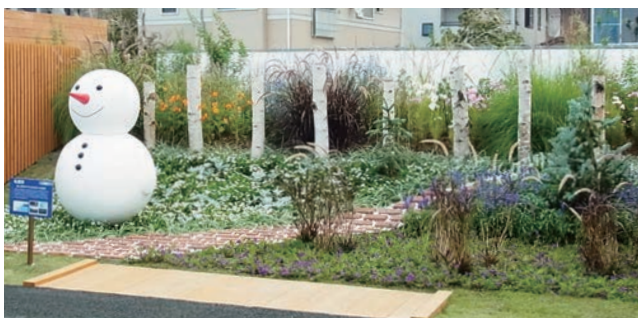
札幌市 白い世界の下にある花々の色彩