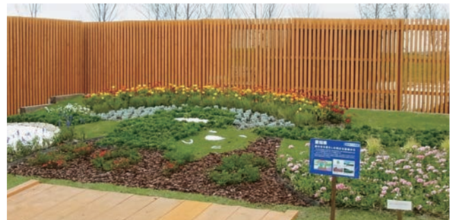
愛知県 緑のある暮らしの明日を愛知から