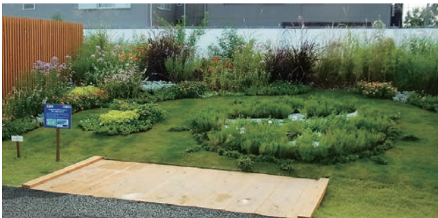
広島市 花と緑あふれる街ひろしまから 平和への願いを込めて