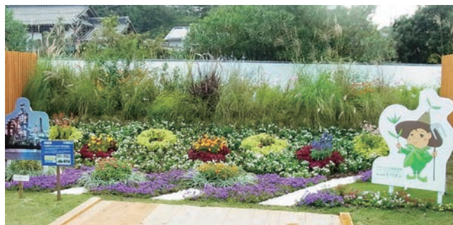
川崎市 森の妖精モリオンとめざす 100万本植樹♪