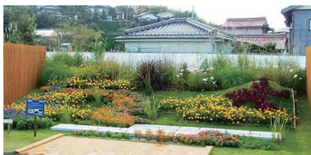
京都市 山紫水明の京都