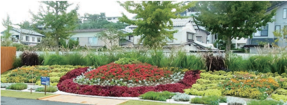
静岡県・浜松市 赤富士と凧揚げ合戦