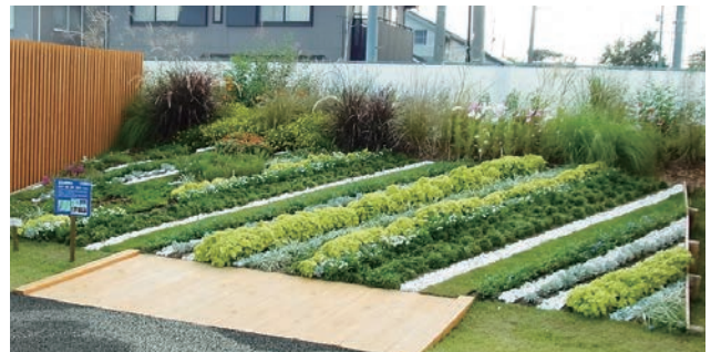
北九州市 結び合う ちから 未来へ 響きあう 北九州市