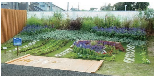
福岡市 アジアの玄関口 ～海に開かれたまち福岡、博多～