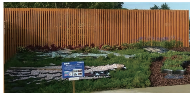
島根県 神話のふるさと「しまね」