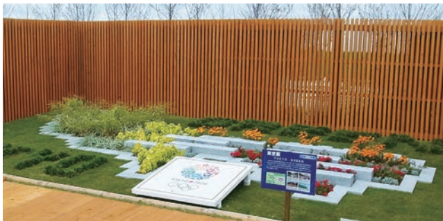
東京都 TOKYO GREEN