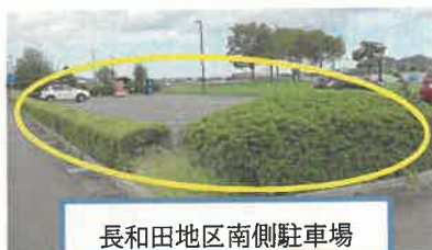
長和田地区南側駐車場