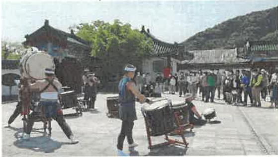
地元伝統芸能公演自主