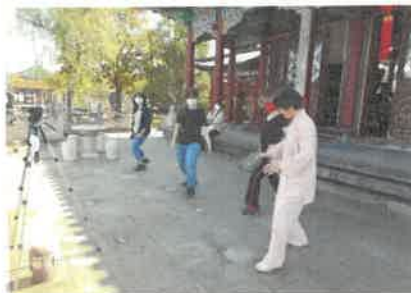
ふれあい太極拳(月1回)

●地域住民に継続的にご参加いただける太極拳や二胡、中国語の教室を開催します。県外観光客も気軽に参加でき、 地元の方との交流の機会 を提供します。