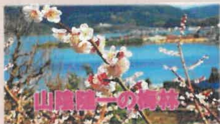
野花梅溪散策ツアー