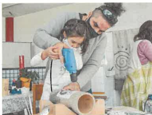
竹灯籠づくりを楽しむ外国人親子