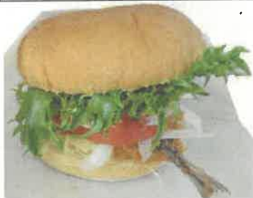
境港アジフライバーガー