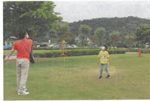
イベント「芝生広場で遊ぼう」