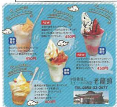
オリジナルスイーツ各種