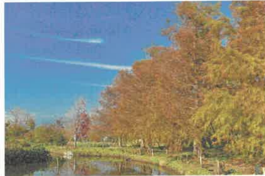
湖岸のラクウショウ