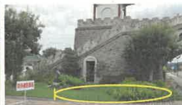
③ 金山嶺橋東郷湖側(西側)