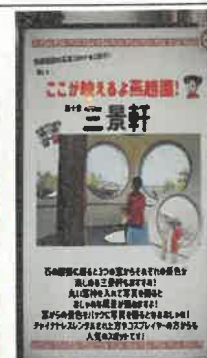
デジタルサイネージ