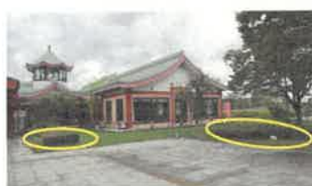
① 道の駅飲食施設横