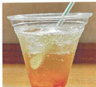
野花豊後梅ソーダ