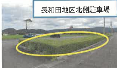
長和田地区北側駐車場