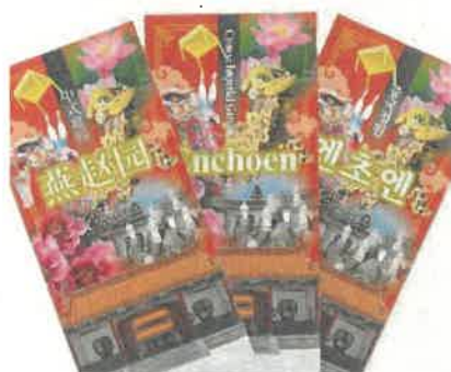
外国語パンフレット