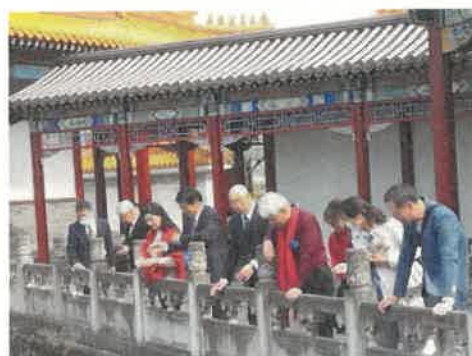
R5 年度 元中国大使や人民日報編集長を含む関係者を鳥取県及び燕趙園を紹介