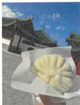
「肉まんはじめました」SNS広報