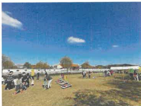
鳥取県レクリエーション大会誘致