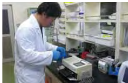
理化学検査（血液検査）