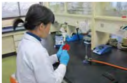
微生物検査（細菌培養）

肉眼検査で判断が難しい場合は、精密検査（微生物検査、病理組織検査、理化学検査）を行います。肉眼検査結果と精密検査結果から、食用となるかどうかを総合的に判断します。また、24ヶ月齢以上の牛並びに全月齢のめん羊及び山羊のうち、原因不明の神経症状等が認められる場合に、伝達性海綿状脳症（TSE）スクリーニング検査を実施しています。