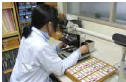
病理組織検査（組織鏡検）