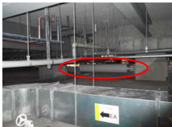
当院での設置状況(写真奥に設置) (ダンパー径：406mm、施工長さ：3940mm/基) (重さ：1287kg/基)