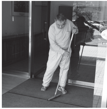
▲ 役場での清掃作業

今後も、町では障がい者雇用拡大だけでなく、地域との交流を図る活動を見守り、そしてともに歩んでいけるような取り組みを進めていきます。