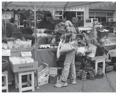
▲ イベントなどでの交流も大切にしています