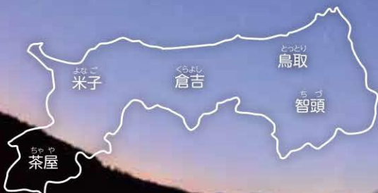
鳥取県内の一年間の平均気温(平成29年1月~12月)