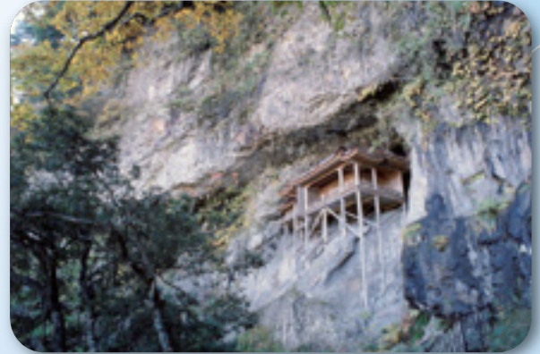
みとくさんさんぶつじなばいれどう 三徳山三仏寺投入堂(三朝町)