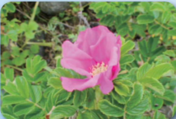
白兎海岸(鳥取市)、松河原海岸(大山町)