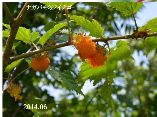
ナガバモジイチゴ