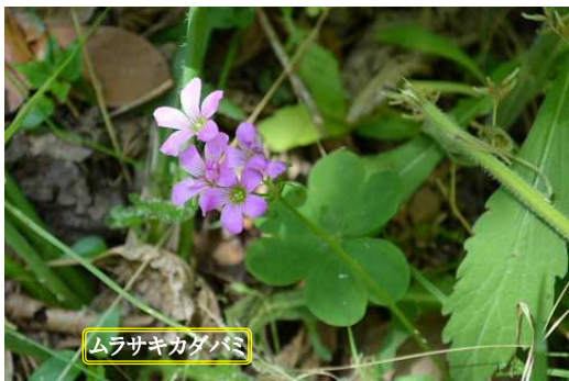
ムラサキカタバミ