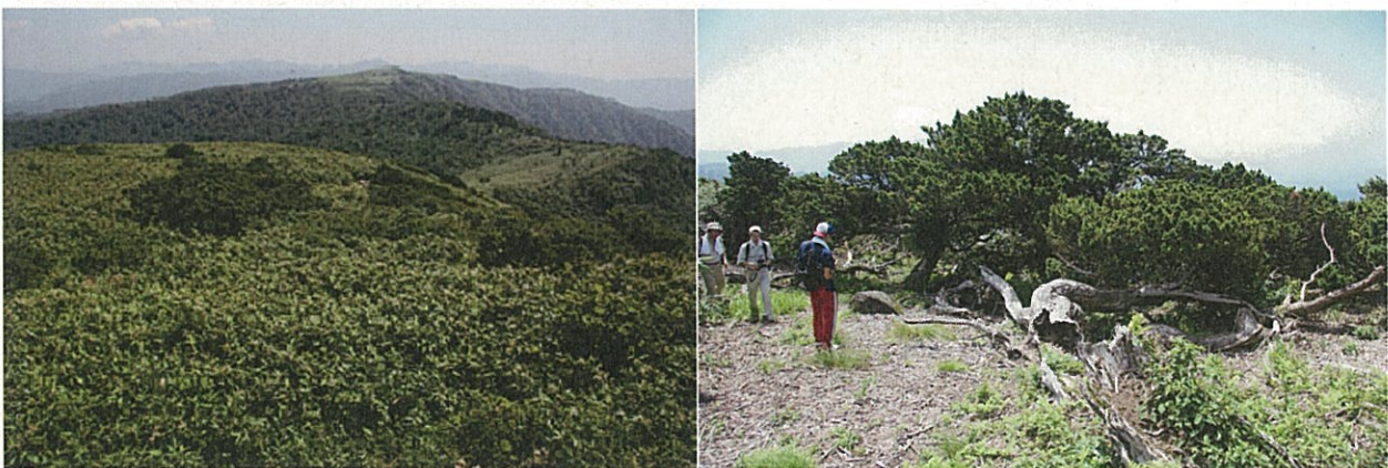
氷ノ山のキャラボク群落 (近景の濃い緑がキャラボク)

氷ノ山のキャラボク群落は中国山地では大山に次ぐ規模をもつ。著名な図鑑類(原色日本植物図鑑など)で大山とともにキャラボクの生育地として言及されるなど日本全体の自然分布からみてもその価値は高い。最大の群落である大山から約90km離れた氷ノ山のキャラボクは、種の存続とその遺伝的多様性確保の点から、一定の個体数を持つ群落として貴重である。