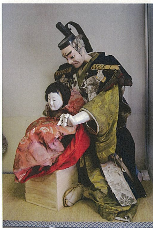
武内宿禰と応神天皇

そのため、平成22年度から4ヶ年をかけて詳細調査と画像記録作成作業を行い、結果を報告書としてまとめ、平成26年3月に刊行したところである。その過程で指定当時の点数と齟齬を来していることが判明し、このたびあらためて整理した結果を基に、指定点数を確定した上で、追加指定するものである。