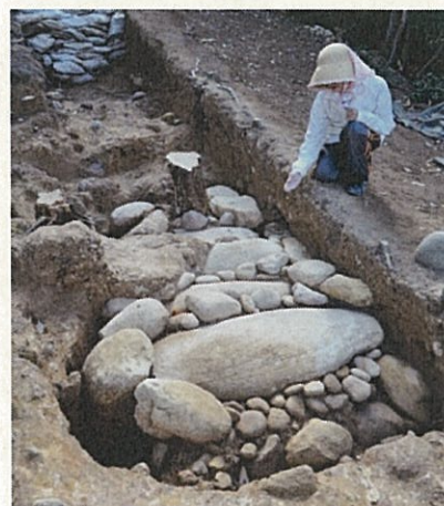
大きな蓋石を伴う埋葬施設(仙谷8号墓)

(2) 発掘調査地は、斜面地で足場が悪く来場者の安全確保が難しいため、平時は非公開です。