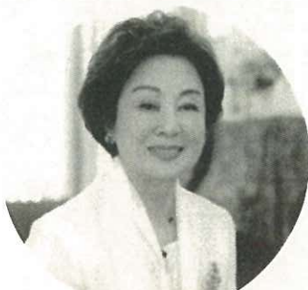
司 葉子さん (女優 鳥取県出身)