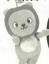
長野県代表 アルクマ