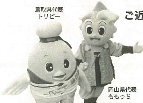
岡山県代表 ももっち