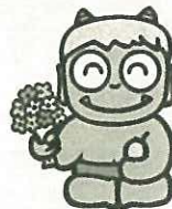
香川県代表 親切的な青鬼くん