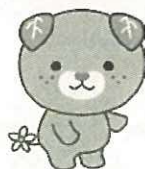
愛媛県代表 みきゃん