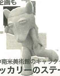
備前市 中南米美術館のキャラクター 歌のペッカーリーのステージ

鳥取県・岡山県の食材の魅力や観光などお二人の思い出と合わせて楽しくお話いただけます。ご来場者にはプレゼント企画もご用意しております。