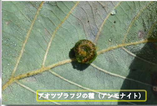
アオツラフジの種 (アンモナイト)