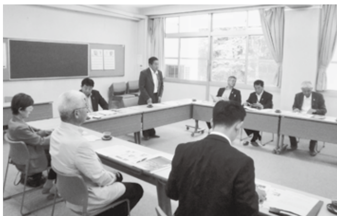
7月14日 兵庫県立村岡高校で調査

授業やアウトドアスポーツなどの体験的な授業などを調査したが、校内外から高い評価と言う。本県でも地域と連携した高校の魅力化の取組が進むよう本委員会として議論を重ねていく。