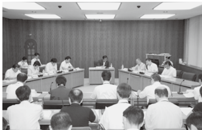
福祉生活病院常任委員会での審議

特に「鳥取県薬物の濫用の防止に関する条例の一部改正」は、成分が特定されなくても、興奮、幻