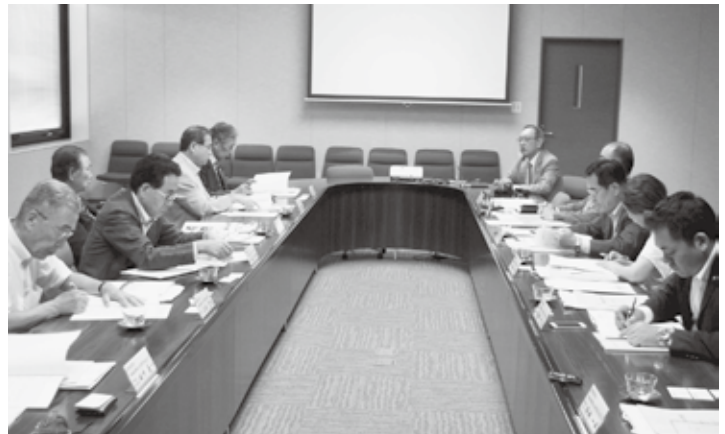
7月30日 札幌国際大学で調査

7月に県外調査として、JR西日本本社、札幌国際大学、札幌市役所等を訪問し、本県を走行予定の新型寝台列車、高等教育機関における地域振興への取り組み、コンテンツ特区の運営等について調査を行った。各地の地域振興を担っている皆さんの声を聞き、その手法を学ぶことは大変有意義であった。このたびの調査で得られた知見を今後の政策立案に繋げて