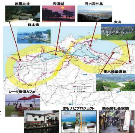
『人間文化の原風景～ご縁をつなぐ神仏の通ひ路』