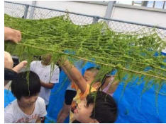
スジアオノリの収穫