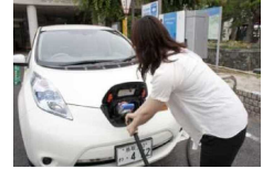
充電の様子（皆生温泉観光センター）