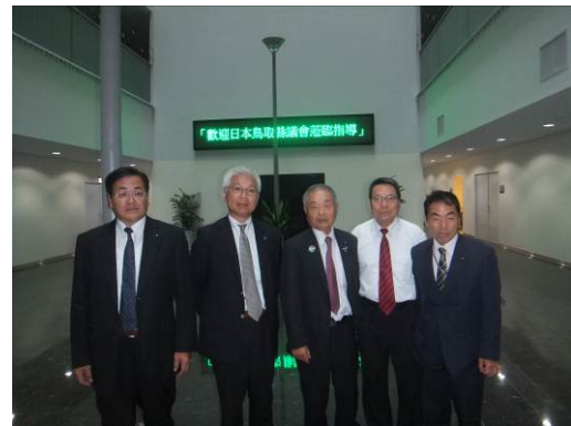
張秘書長（右から2人目）を囲んでの記念撮影