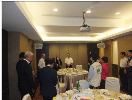
歓迎夕食会の様子

台中市議会主催の歓迎夕食会を開催していただき、議員、秘書長のほか多くの職員と意見交換を行った。