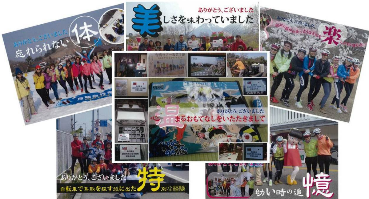
ツアー参加者の皆さんが作成されたパネル