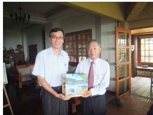
王区長との記念品交換