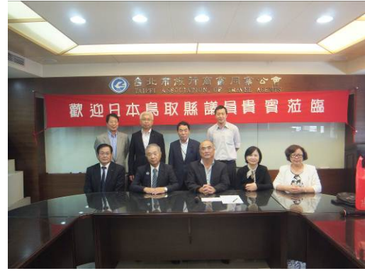
丁副理事長（前列中央）らを囲んで記念撮影