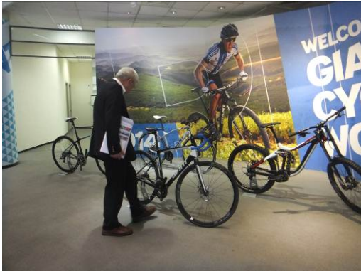
ジャイアント社本社ショールーム