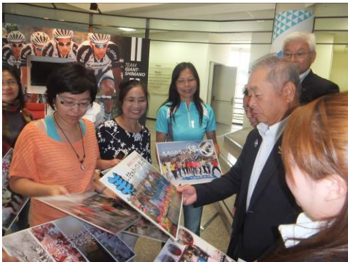
ツアー参加者との意見交換