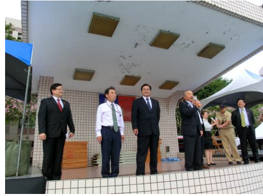
全校生徒へのあいさつ