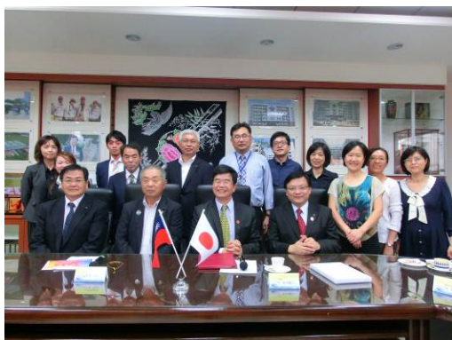
游校長（前列左から3人目）、黄会長（同4人目） を囲んでの記念撮影