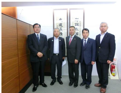
花木代表（中央）を囲んでの記念撮影