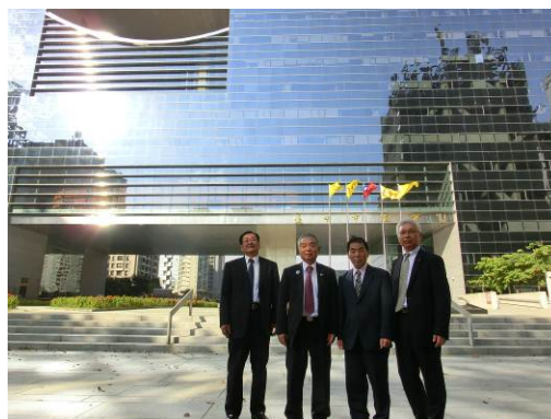
台中市議会議事堂前