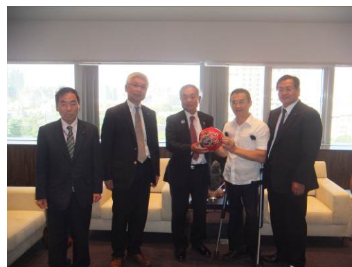
徐副市長（右から2人目）を囲んでの記念撮影