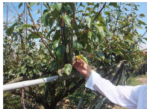
接ぎ木された部分