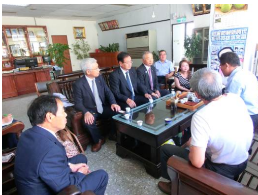
石岡区農会との意見交換の様子

農会は会員によって組織され、石岡区農会の会員数は3,000人余り。主な農産品はぼんかんて栽培面積は約250ヘクタール、年間約4,500トン。