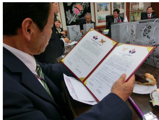
米子東高校との姉妹校協定書