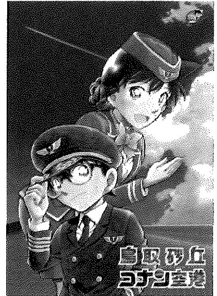
メインビジュアル →