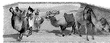
トリックアートイメージ