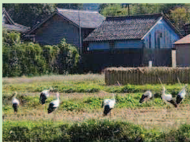
ほ場に飛来したコウノトリ

地域の女性部が中心となり、休耕田で枝豆を栽培し、収穫した枝豆を活用した高齢者施設の入居者との交流を図っています。また、施設の保管理及び長寿命化活動については、構成員の自警団が中心となり、排水路の嵩上げや法面の土砂崩落防止工事などを生産法人の機械等を借りながら、できるだけ直営施工による活動を実施しています。