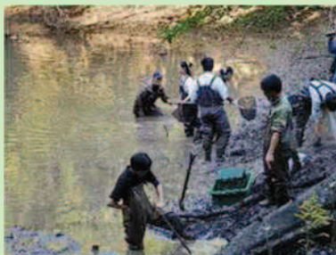
地域協力隊・大学生の協力による ため池の環境保全活動