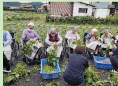
枝豆のもぎとり体験交流