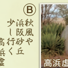
少浜秋阪風高行砂や高浜虚子