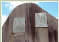
武郎、晶子侘涙の地