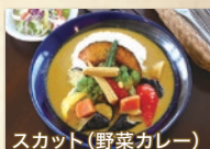
スカット(野菜カレー)

人気はチョイ辛の野菜カレー。 TEL 0857-23-1346 ◎8:00~17:00(無休)