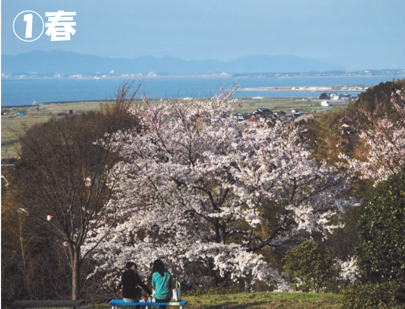
中海とお花見(安来市・王陵の丘公園) 撮影者: 高橋幸夫さん(※)