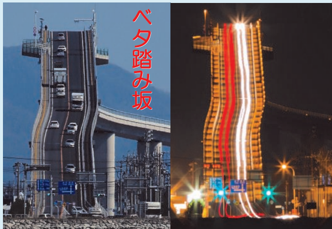
天に昇るような急勾配の坂

この橋は、国土交通省が境港と後背の島根県東部地域との輸送時間とコストの削減、渋滞解消を目的に建設し、平成16年の完成後は境港管理組合が管理しています。