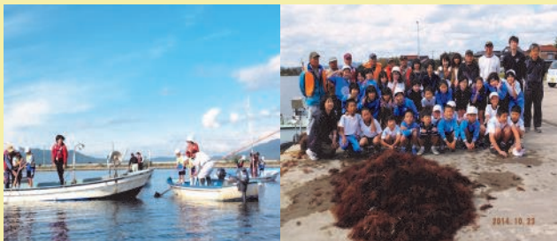
中海の海藻を刈り取る体験

私たちは、この生物多様性アクション大賞に「美味しい!楽しい!ためになる!We LOVE 中海」を紹介しました。この活動は2012年から、小学生・地域住民の方々を対象に地元漁協の協力で、中海の海藻を刈り取る体験と、その海藻を肥料として育ったサツマイモを収穫する体験、そして海藻や海藻肥料で育った野菜を味わう体験を一連の活動として行っています。