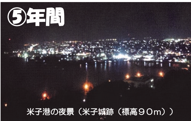
米子港の夜景(米子城跡(標高90m))