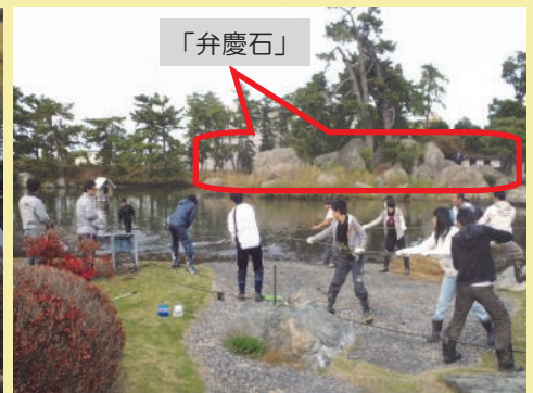
「手作りジョレン」に結びつけたロープを引く

り込むことで、湖底環境が改善されるという方法です。「手作りジョレン」に結びつけたロープを、参加したみなさんが遊び感覚で楽しく引っ張って、池の底をかきまぜました。