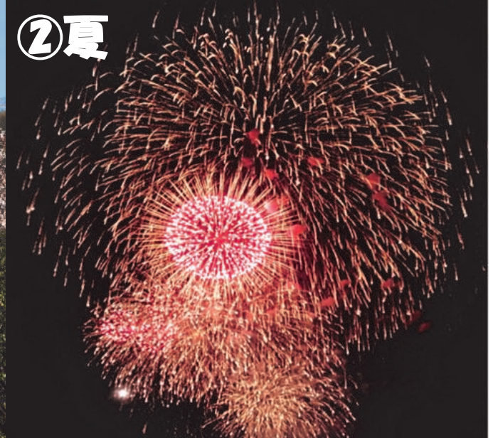
中海で花火 米子がいな祭がいな大花火大会(米子港)