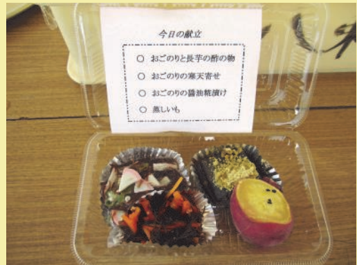
海藻や海藻肥料で育った野菜を味わう体験

審査委員から、「昔は中海に限らず日本各地の汽水湖でこのように海藻をとって有機肥料として活用されていましたが、今はそれをやらなくなってしまいました。それを“味わう”という視点から、小学校の授業などにもプログラムとして組み込みたくさんの人々に感心をもってもらうよう広めているところを評価しています。