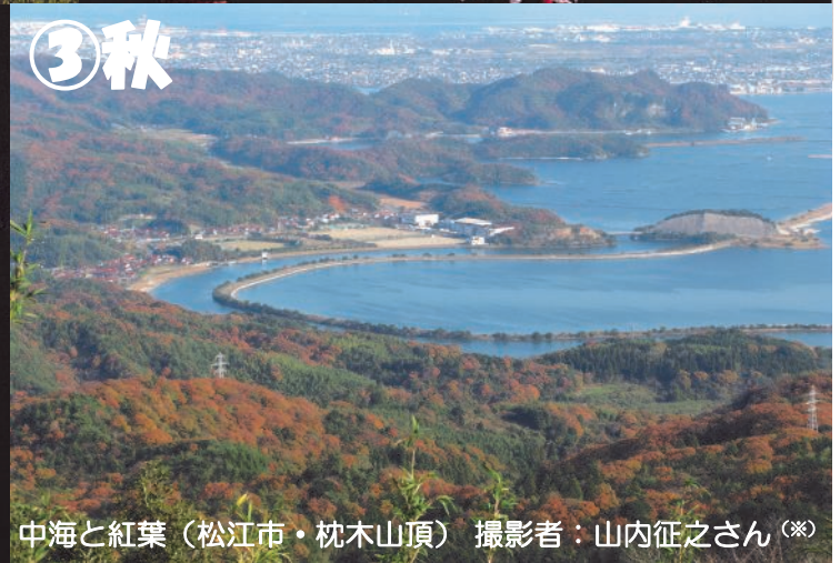
中海と紅葉(松江市・枕木山頂)