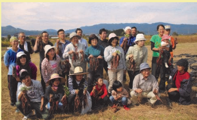
海藻肥料で育ったサツマイモを収穫する体験

中海に「触れる」、地域の人・水・土に育てられた【中海の恵み】を「味わう」ことで、私たちが守るべき生きもののサイクルや自然と人との関わりを伝え、地域住民に愛され、守られる中海を取り戻したいという思いで始めました。