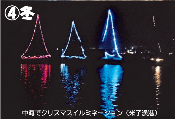
中海でクリスマスイルミネーション(米子漁港)