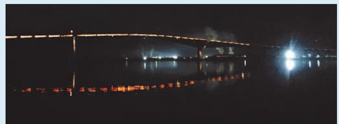
夜のライトアップ

ライトアップされた江島大橋は、とても美しい芸術作品のように楽しめる夜景となっています。