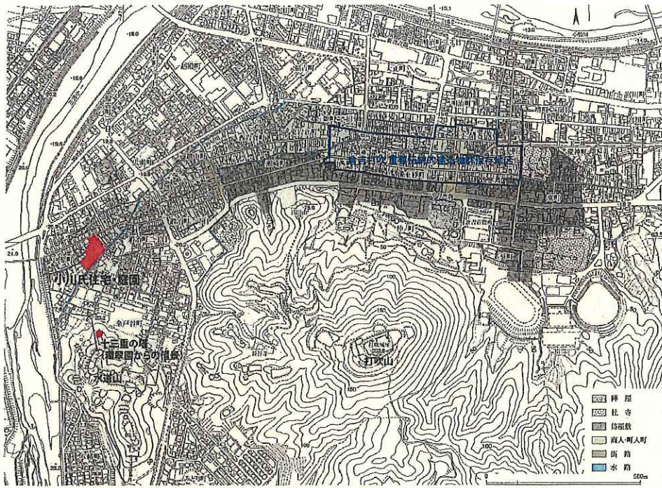
小川氏住宅・庭園位置図