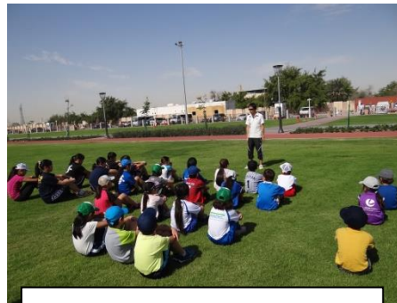
校庭は学校になく、公園で外運動（体育）をしています。