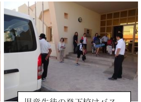
児童生徒の登下校はバス