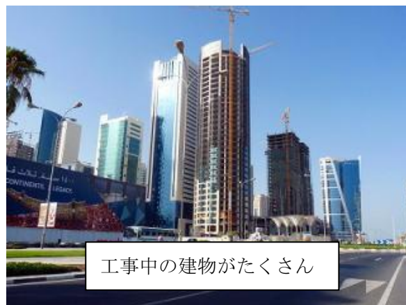
工事中の建物がたくさん

また、ドーハ市内から少し離れる（車で30分程度）と、まだまだ開発の手が伸びていない砂漠地帯が広がっています。鳥取砂丘とは異なり、こちらでは砂漠を車で走ること（オフロード）もできます。