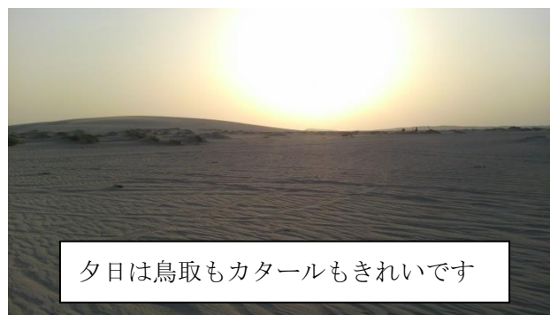
夕日は鳥取もカタールもきれいです

日本からすると治安の心配をする人も多いと思いますが、カタールの治安はとても良いと思います。中東といえば、女性は一人で歩いては危ないとか、テロの危険性があるというイメージかもしれませんが、実際に生活してみると、まったくそんなことはありませんでした。ただ、カタールに住む人は運転が荒いという印象を受けました。クラクションを鳴らしたり、ウィンカーを出さずに車線変更をしたり、スピード超過をしたりすることがよくあります。そのためか事故も多く、毎日事故を起こしている現場を見かけます。危険な場所には毎日警察がきて巡視をしています。