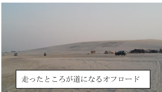
走ったところが道になるオフロード

また、ドーハ市内から少し離れる（車で30分程度）と、まだまだ開発の手が伸びていない砂漠地帯が広がっています。鳥取砂丘とは異なり、こちらでは砂漠を車で走ること（オフロード）もできます。