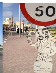
日本とは異なる標識を見つけるのもおもしろいです