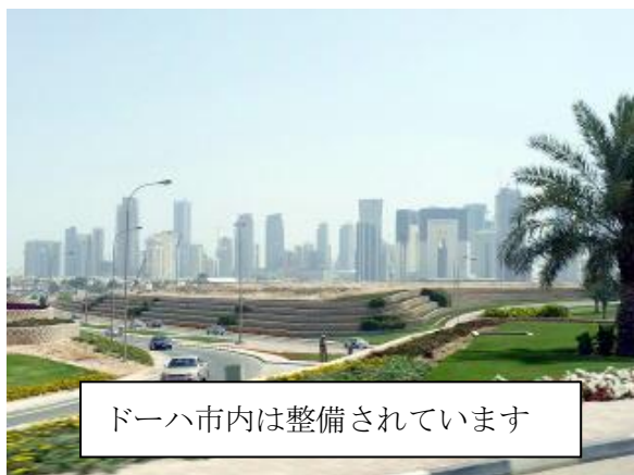
ドーハ市内は整備されています

カタールはまさに発展途上国という言葉がぴったりの国でした。戦後、急速に発展していった日本を彷彿とさせる気がします。カタールは今、町全体が建設ラッシュで、豪華で高いビルが建ち並び、カタールが成長期にある国であることを感じさせます。