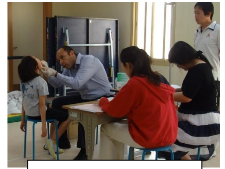
歯科検診などの検査もちゃんとやります。