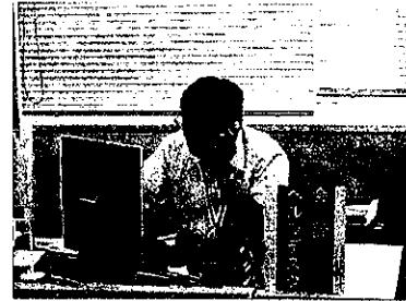
<会計ヘルプデスク>

平成26年4月に、会計管理者会計局会計指導課及び西部総合事務所会計総務課に専門職員を配置し、各所属で会計事務に携わる職員やその上司からの、会計事務（制度、実務）に関する様々な相談や質問に対応する専用の窓口として開設した。