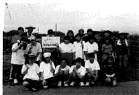
【農業体験による立ち直り支援活動】