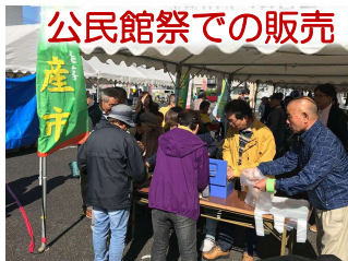
公民館祭での販売