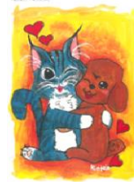
<ゆーむとあーむの3Dクリアファイル/クリアファイル>

この運動の一環としてみなさまに募金をお願いしています。募金協力者には「友情の絵はがき」「愛の絵はがき」「ゆーむとあーむのクリアファイル」を贈り、肢体不自由児者への理解と関心を深めていただくことを目的としています。皆様の温かいご支援をお願いします。