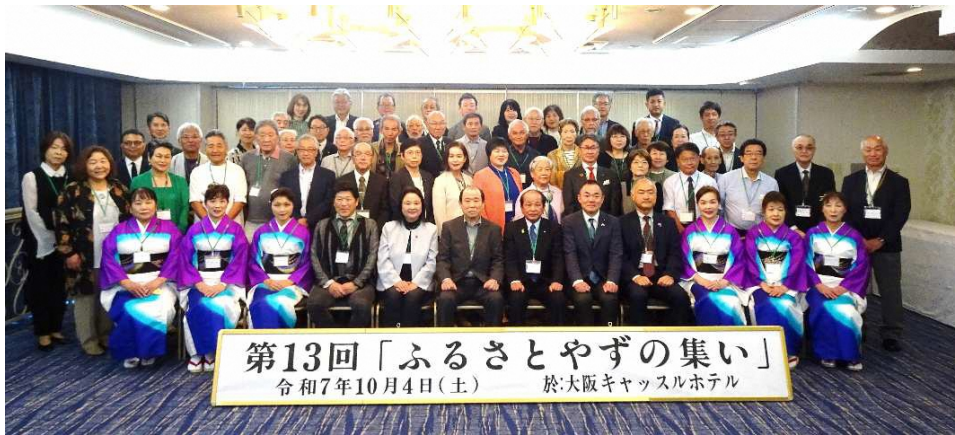
このたびも交流を深めた参加者のみなさん 2025.10.4 @大阪キャッスルホテル