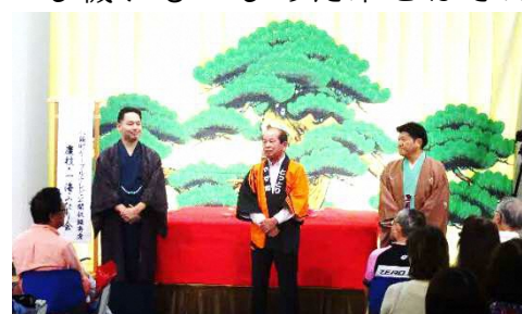
今回は吉田町長も会場に駆けつけ おふたりとの掛け合いで八頭町PR