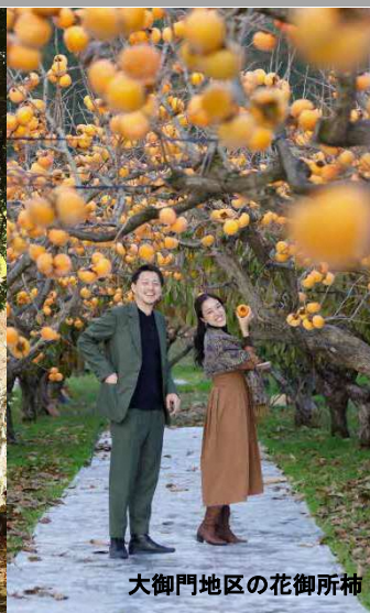
大御門地区の花御所柿