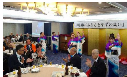
合併20周年を迎えた八頭町 みんなで輪になって八頭町音頭♪